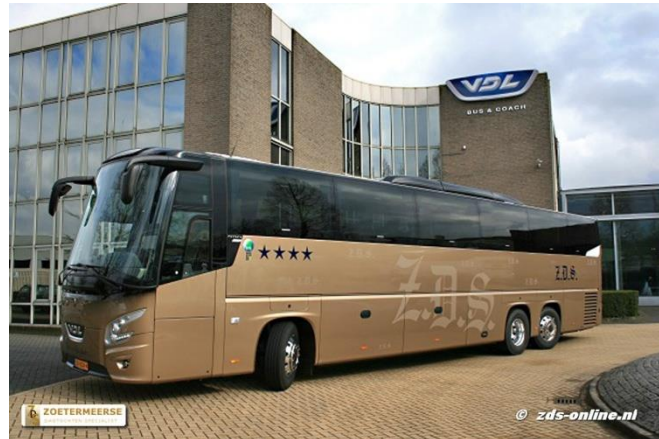
Zoetermeerse Dagtochten Specialist.