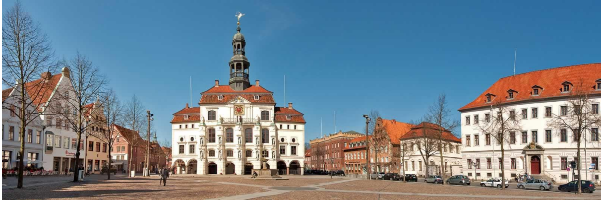
Am Markt met in het midden het Rathaus

In het Undeloher Hof wordt koffie met een enorm stuk gebak uitgeserveerd. Als we het gebak eindelijk hebben weten te verschalken rijden we richting Lüneburg. De stad Lüneburg is meer dan 1000 jaar oud en heeft veel prachtige middeleeuwse patriciërshuizen. We hebben daar tijd om zelf de stad te bezoeken.