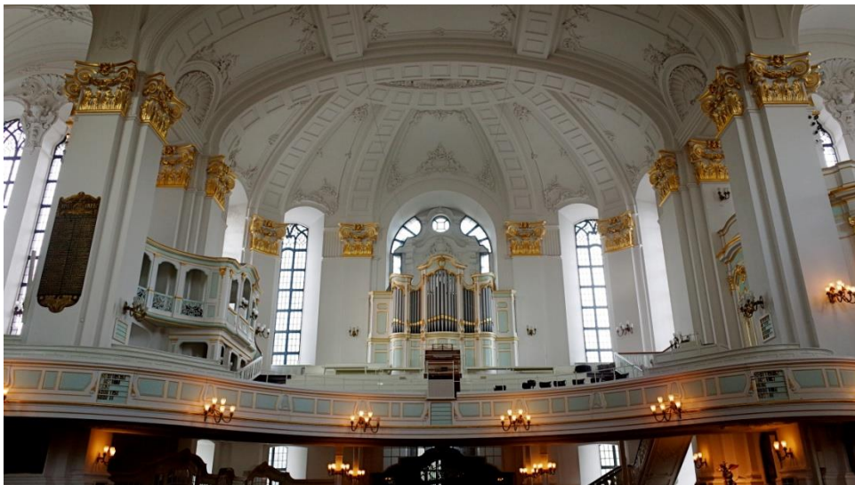
Een van de vier orgels

We stappen uit bij de Sint-Michielskerk. Deze Evangelisch-Lutherse kerk heeft vier orgels. Drie daarvan zijn zichtbaar en de vierde zit verscholen achter een van de andere. Om 12.00 uur zullen de orgels gedurende 20 minuten worden bespeeld, maar dat blijkt maar ten dele waar. Het is gewoon een kerkdienst waarbij ook op het orgel wordt gespeeld.