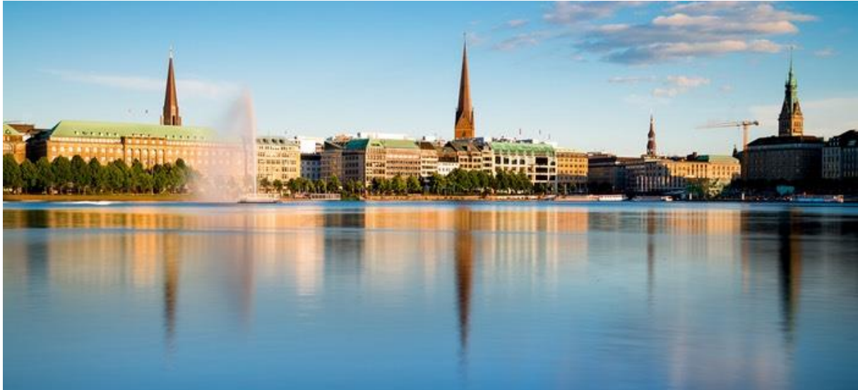
Gezicht op het stadscentrum vanaf de Lombardsbrücke over de Binnenalster.

Vervolgens komen we in de Speicherstadt, een complex van pakhuizen, gebouwd tussen 1883 en 1927 op een reeks eilandjes in de rivierbedding van de Elbe. Deze opslagzone maakt deel uit van een ouder deel van de haven van Hamburg.