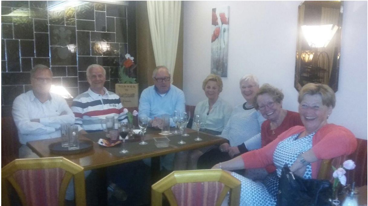
En gezellig was het!

Om half vier aanvaarden we de terugreis. Het gemeenschappelijk diner gebruiken we in AanEen in Emmeloord, vlak aan de A6. Rond kwart voor negen komen we in Enkhuizen aan, vermoeid, maar terugkijkend op heel gezellige en interessante vier dagen.