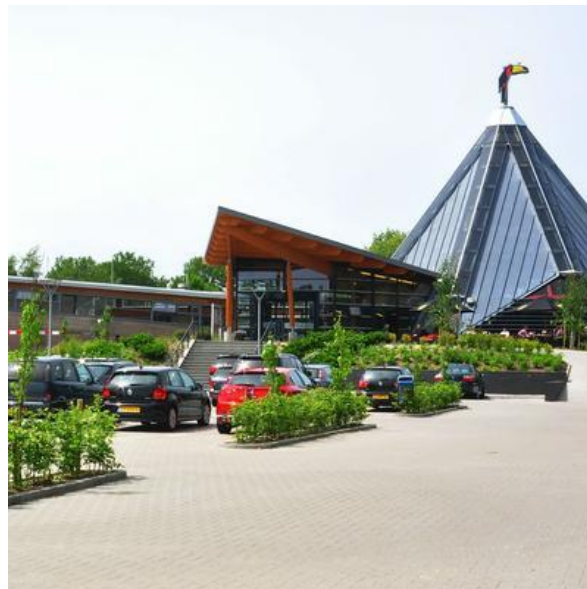
Van der Valk Drachten.

Het is de bedoeling dat we in Joure een koffiestop maken, maar om de een of andere reden kunnen we daar niet terecht en we rijden daarom door naar Van der Valk in Drachten.