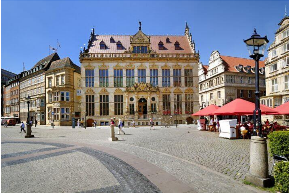
Het Schütting, gebouw van de Koopmansgilde en zetel van de Kamer van Koophandel

De Schnoor is de oudste wijk van Bremen. De originele bewoners van dit bontgekleurde wijkje waren vissers, handelaren en ambachtslieden. Gelukkig zijn de typische huisjes in dit gebied tijdens de tweede wereldoorlog van grote schade bespaard gebleven. Het is een openluchtmuseum van smalle straatjes, kleine huisjes, gezellige cafeetjes en bijzondere winkeltjes.