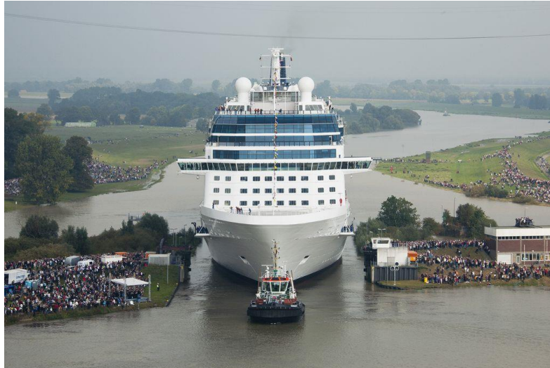
Op weg naar zee.

Na de lunch in het plaatsje Papenburg zelf zijn we doorgereden naar ons hotel in Rosengarten-Sieversen. Hotel Holst ligt ten zuiden van Hamburg, direct aan de A261, de verbinding tussen de A1 en de A7, ongeveer 30 minuten rijden van het centrum van Hamburg.