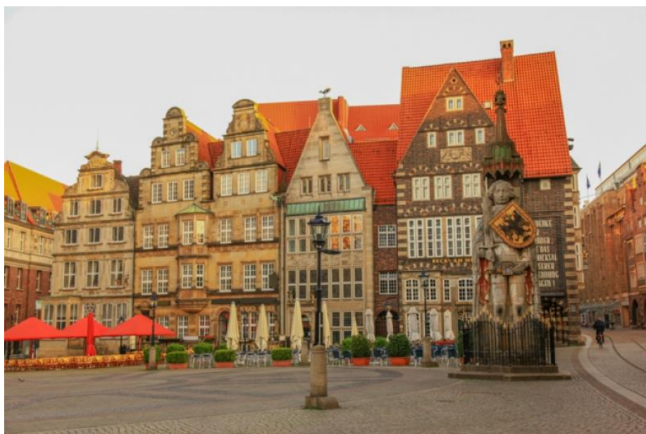
Het Rolandstandbeeld op de Marktplatz