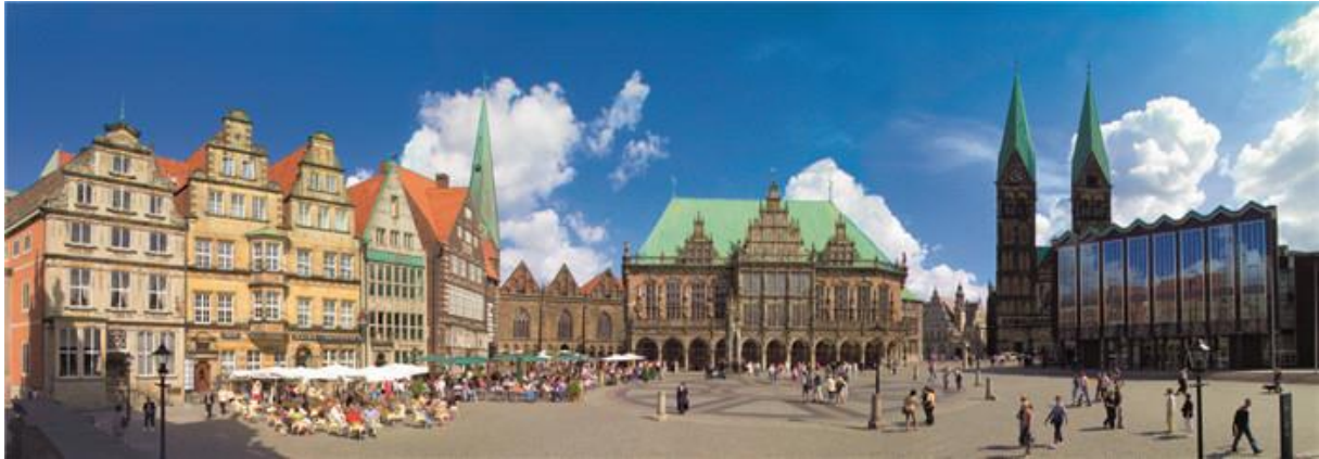
Marktplatz met in het midden het Rathaus en rechts de St. Petri Dom

Naast het Rathaus staat het beeld van de vier stadsmuzikanten. Dat zijn vier dieren uit een sprookje van Grimm, die om verschillende redenen muzikant worden en samen naar Bremen trekken. Als je de ezel met beide handen aan de voorpoten vasthoudt, dan gaat een wens in vervulling. Daardoor zijn de voorpoten van het bronzen beeld inmiddels glanzend geworden.