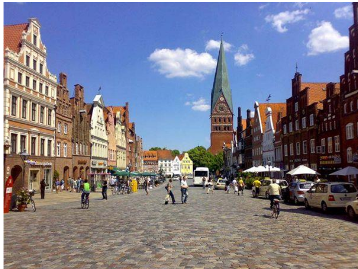
Am Sande met de Sint-Johanneskerk